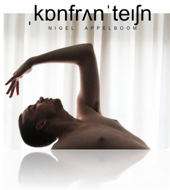
Nigel Appelboom – Solo poster 2019