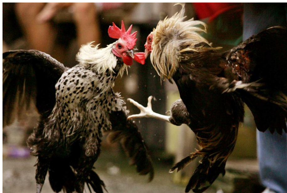
Roosters fight in Manila

geluid opbouwen of samen met een acteur of vormgever werken aan iets moois. Probeer vooral uit en gebruik de ruimtes als lab om jezelf ook te ontwikkelen. Zo kun je de dingen die je in de les toepast ook in de praktijk brengen.